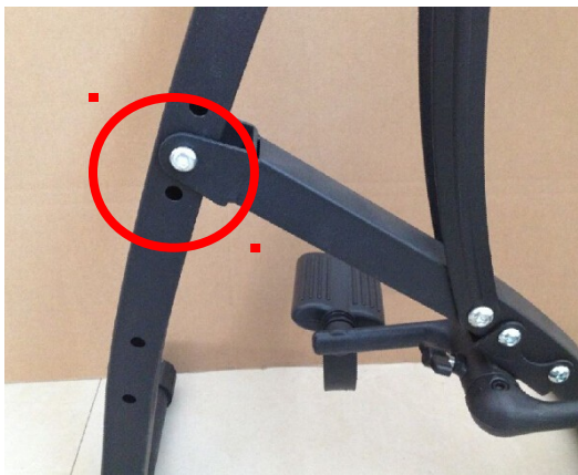
A. Brug skrue for at fastgøre pedalerne